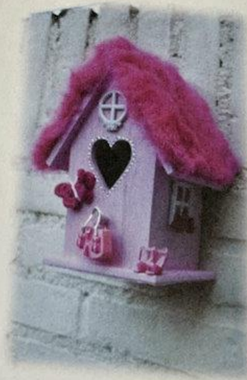
Dream house Barbie